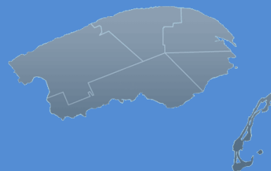
Table de concertation en sécurité alimentaire Gaspésie / Îles-de-la-Madeleine

Spéciaux en vigueur chez tous les organismes participants 2009-2010